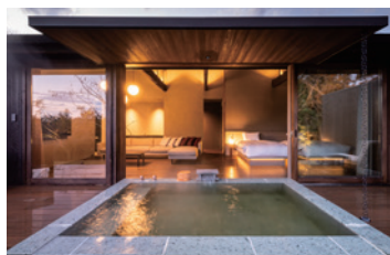
【886 / 露天風呂付洋室】 一面に広がる星空と森を望みながら贅沢にかけ流す湯をひとりじめ。