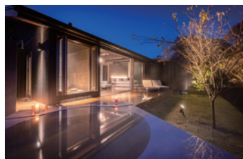
【887 / 露天風呂+檜内風呂付洋室】 人気No.1。迫り出す露天に浸ると自然と同調するような感覚に。