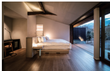
【881 / 半露天風呂付洋室】 おこもり最適な落ち着いたお部屋。半露天風呂は雨でも安心。

2021年11月18日にリニューアルオープンいたしました離れ88は、おかげさまで1周年を迎えました。