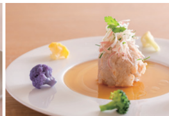
■ 七福神まんじゅう 1,650円