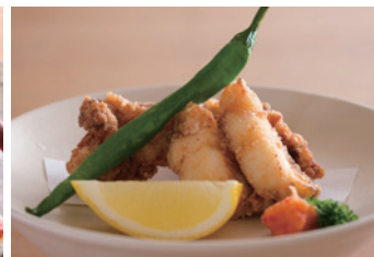
■ ふぐ唐揚 3,300円