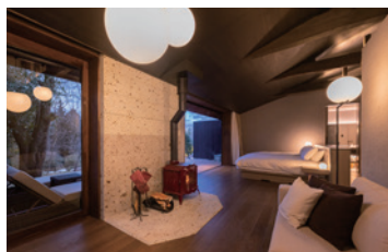
【885 / 半露天風呂付洋室】 春は桜の木を眺めながらの花見風呂。冬は暖炉に火を灯して。