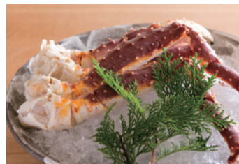
■ タラバガニ炭火焼き 11,000円

本当の贅沢とは何かを考えました。季節毎にご提供いたします。3日前までご予約ください。