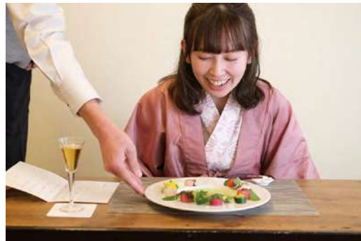
3話／あたたかい歌声