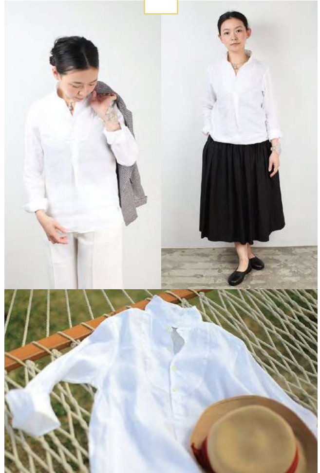
●リネンシャツ(レディース・メンズ) 17,800円~(UNIVERSAL LAB INC.)