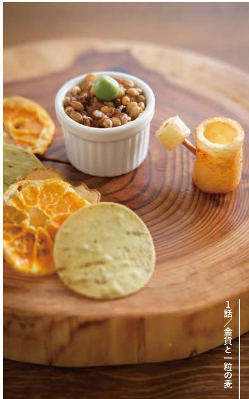
1話／金貨と一粒の麦